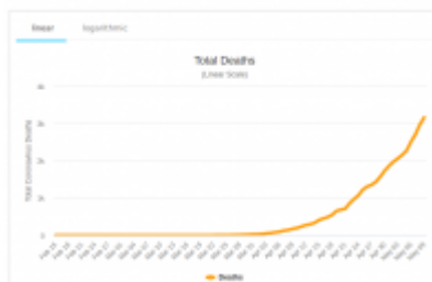
Total Coronavirus Deaths in Mexico

Una vez que se ha contraído la infección, una persona puede seguir transmitiendo el virus a otras personas hasta por 15 días (aunque algunos estudios hablan de 20-25 días de transmisión).